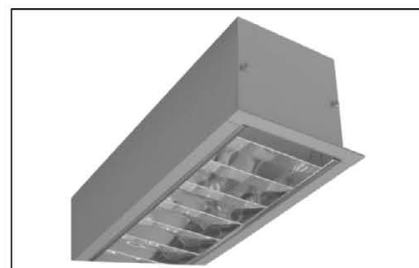
Design P BAP