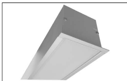
Design P PMO