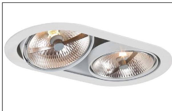
Sawa R2 QR111