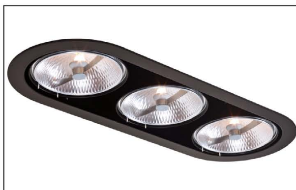
Sawa R3 QR111