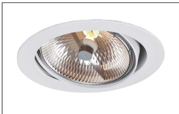
Sawa R1 QR111