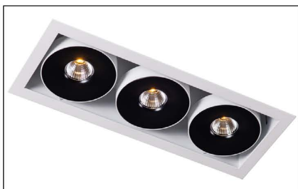
Sawa S3 LED COB