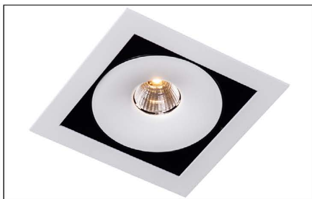
Sawa S1 LED COB