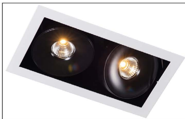
Sawa S2 LED COB