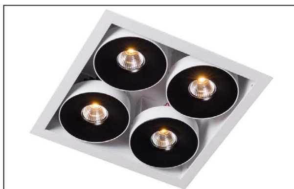
Sawa S4 LED COB