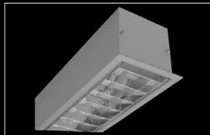
Design P BAP