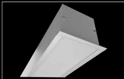
Design P PMO