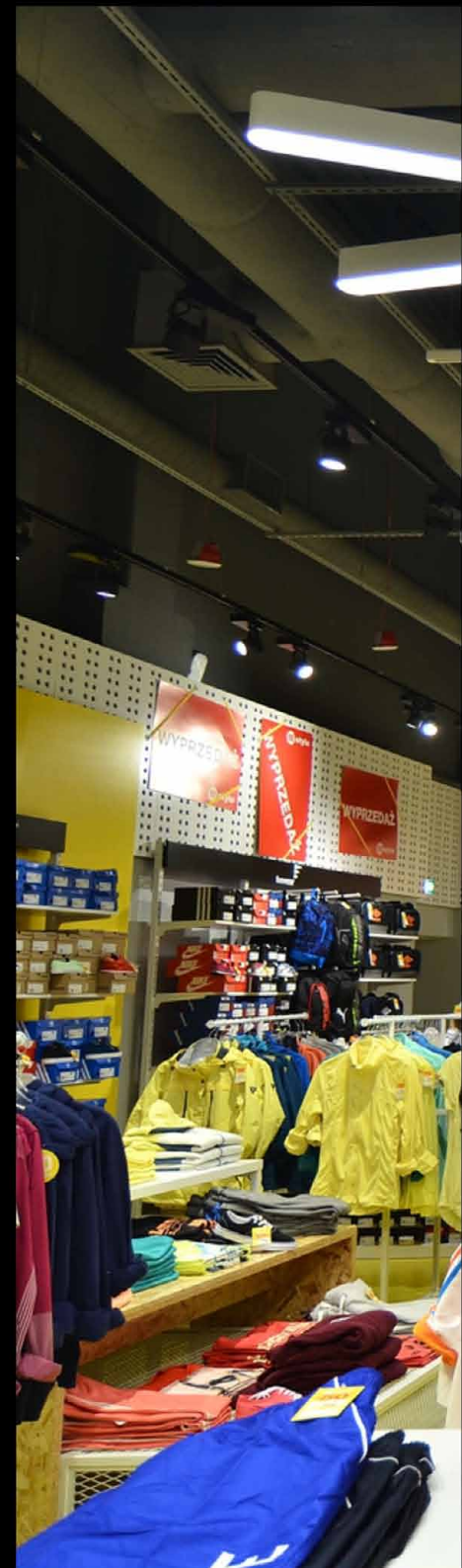
50 Style Bydgoszcz