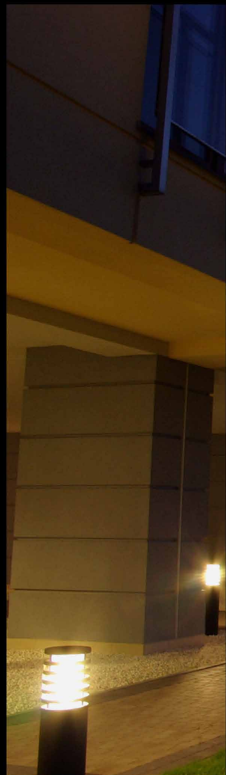
Osiedle mieszkaniowe Eolian Park Warszawa