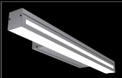
Limit K Base Window