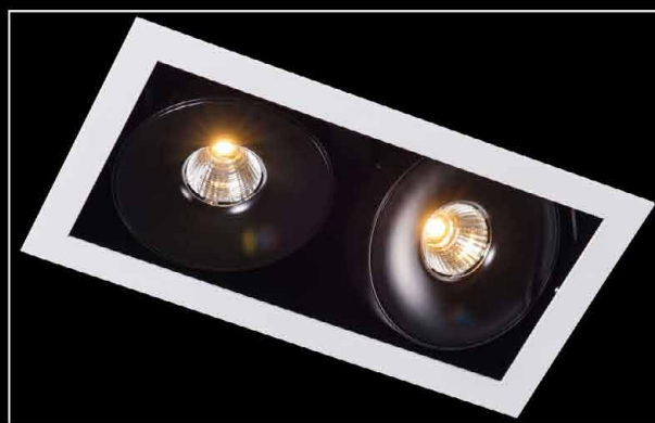
Sawa S2 LED COB