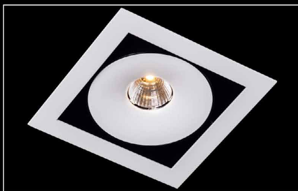
Sawa S1 LED COB