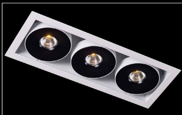
Sawa S3 LED COB