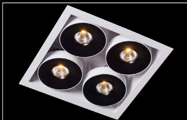
Sawa S4 LED COB