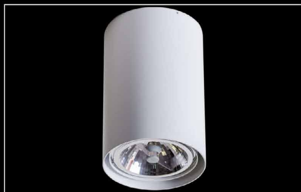
Wars R QR111