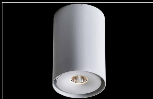
Wars R LED COB